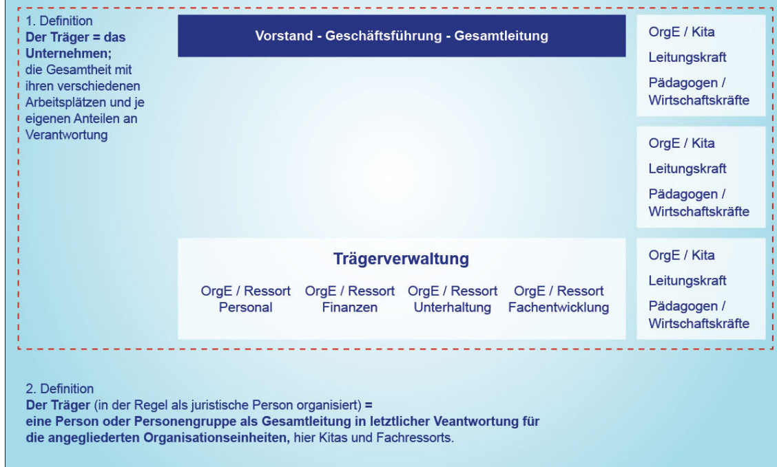
Schaubild 1: Träger von Kindertageseinrichtungen

Der Träger unterhält eine oder mehrere (hier symbolisch drei) Kindertageseinrichtungen und, falls erforderlich für die Erledigung bestimmter organisatorischer und Verwaltungsaufgaben, Fachressorts bzw. andere Organisationseinheiten.