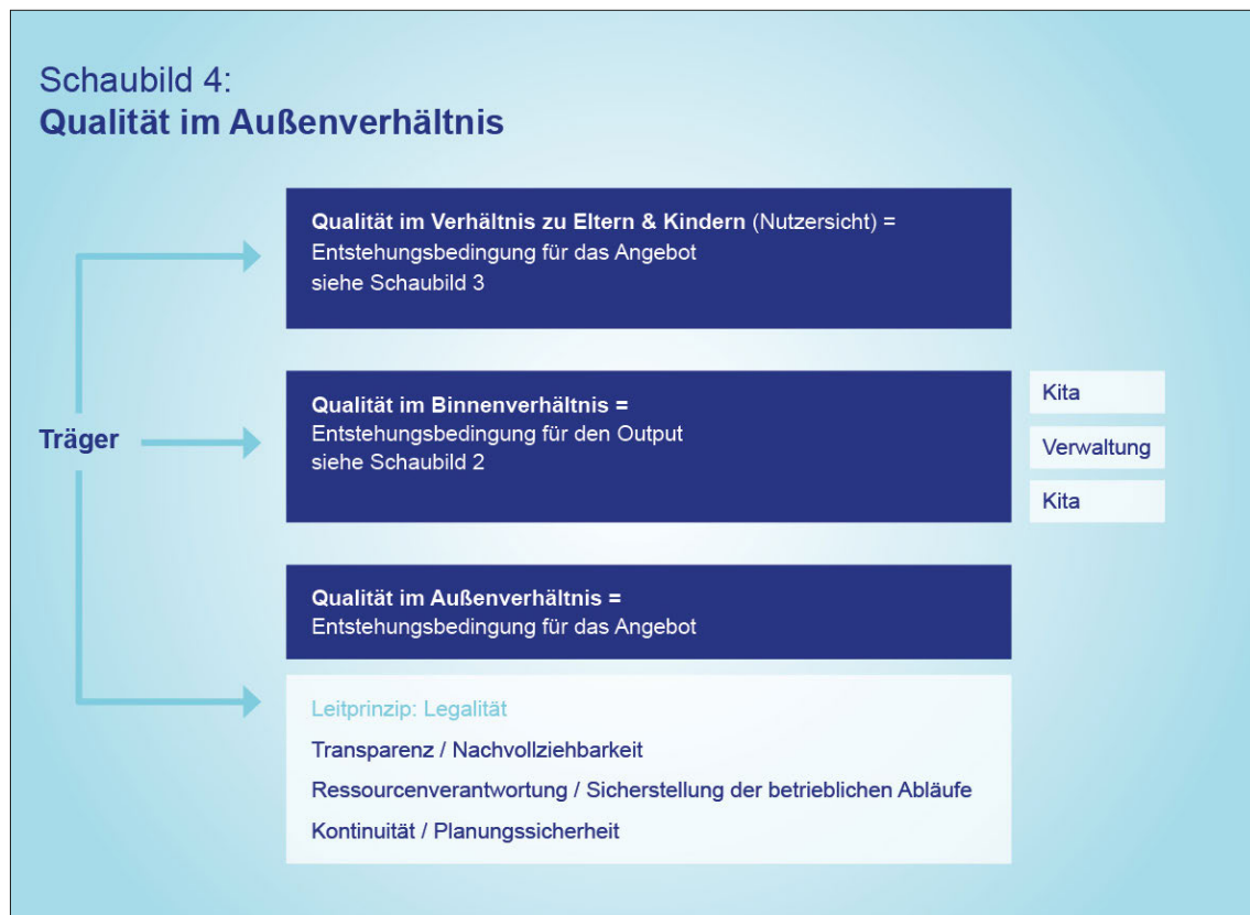
Schaubild 4: Qualität im Außenverhältnis

Kontinuität herzustellen erscheint als Trägeraufgabe, doch Kontinuität ist nur ein Mittel. Die Zielperspektive des Trägers heißt Planungssicherheit für einen im Einzelfall zu definierenden (Zeit-)Rahmen. In der Außensicht repräsentiert die Planungssicherheit das vorrangige Interesse der zuständigen Behörden im Hinblick auf das Platzangebot oder, allgemeiner, auf die Planung des Gesamtangebots der Jugendhilfe.